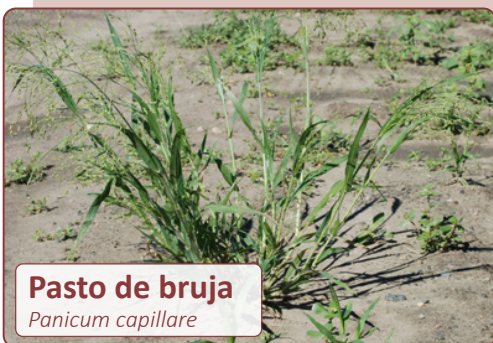
Pasto de bruja Panicum capillare