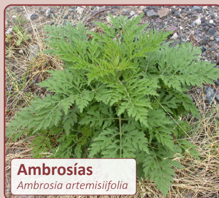
Ambrosías Ambrosia artemisiifolia