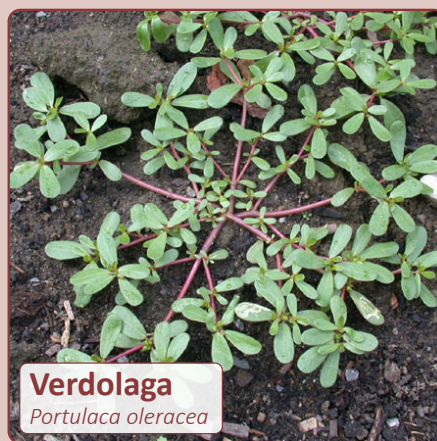
Verdolaga Portulaca oleracea