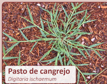
Pasto de cangrejo Digitaria ischaemum