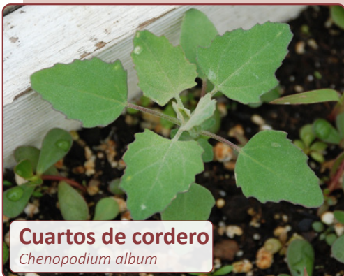
Cuartos de cordero Chenopodium album