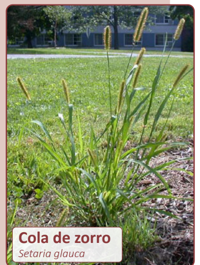
Cola de zorro Setaria glauca