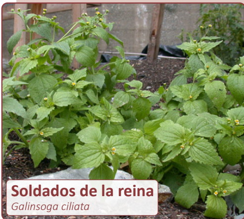
Soldados de la reina Galinsoya ciliata